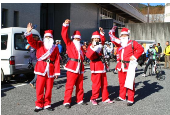
関連イベント／電動アシスト自転車でまちなか ポタリング（たすきでバイコロジーPR）