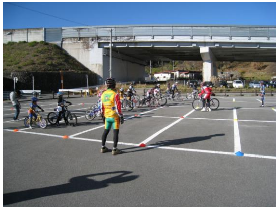
サイクリングの楽しみ方と自転車生活のすすめ教室