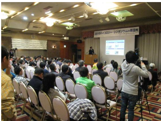
シンポジウム会場の様子