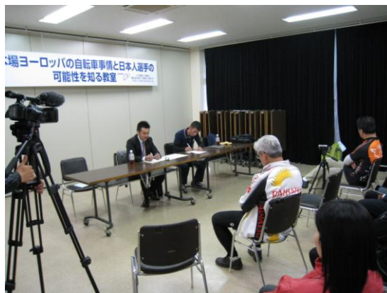
本場ヨーロッパのレース事情と日本人選手の可能性を知る教室