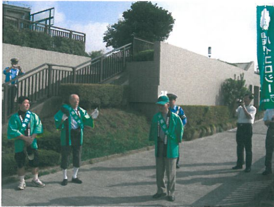
挨拶・注意事項等の説明

「バイコロジ運動」の一環として、自転車利用者の交通ルールの遵守とマナー向上を図り、正しい自転車利用を啓発することを目的として、今年、乗用マナーパレードを行いました。東京都内での実施ということで、本会からも3名参加し、『東京葛飾バイコロジ推進協議会』とともに、交通安全のPR活動を行いました。当日は、晴天に恵まれ、9月の気温としてはやや高い状態でしたが、江戸川の心地良い風を受けて、快適に走行することができました。