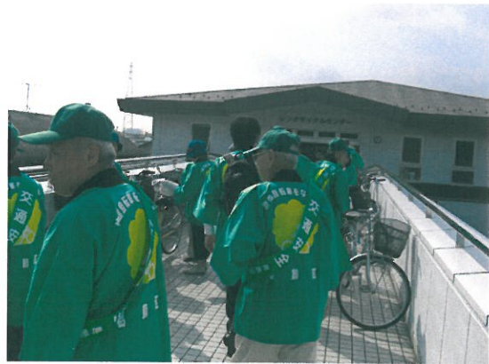
出発前（レンタサイクルセンター）