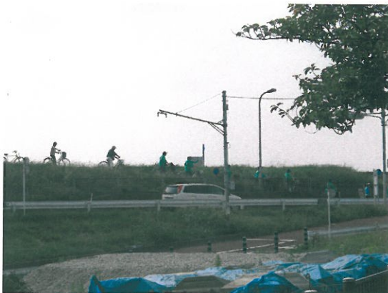
走行時（江戸川サイクリングロード）