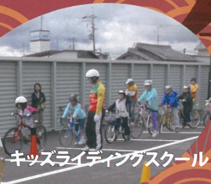
キッズライディングスクール