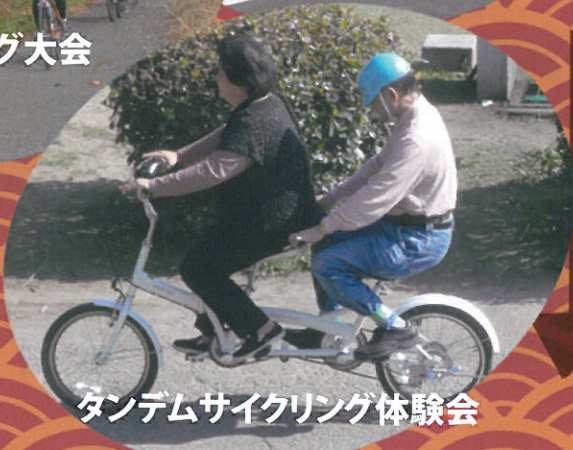
タンDEMサイクリング体験会