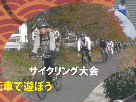
サイクリング大会