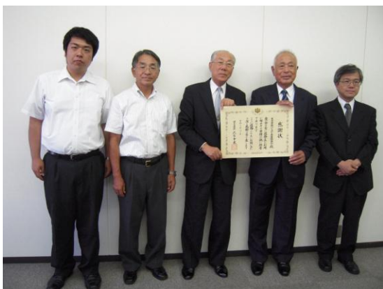
東京葛飾バイコロジー推進協議会 及び葛飾区都市整備部の皆様

標件について、「東京葛飾バイコロジー運動推進協議会」は、日ごろのバイコロジー活動の成果が認められて、国土交通大臣より表彰を受けましたので、ご報告いたします。